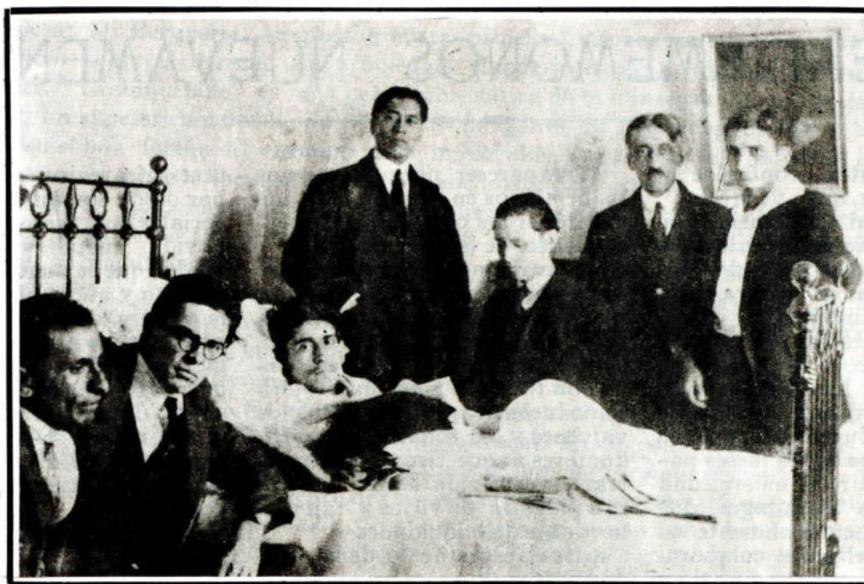
Convalecencia de Mariátegui

das las probabilidades, el destino de la generación que la representa actualmente es ahogarse en su estupidez y en su obscenidad. Dejemos que ese destino se cumpla. Obedezcamos la voz de nuestro tiempo. I preparémonos a ocupar nuestro puesto en la historia.